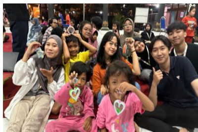
Gambar 7. Kegiatan Pembelajaran Hari Terakhir