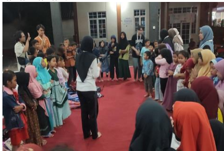
Gambar 2. Kegiatan Pembelajaran Hari Pertama

Pada hari pertama, kegiatan difokuskan pada sesi permainan dan adaptasi. Kegiatan ini bertujuan untuk mengenalkan para mahasiswa KKN kepada anak-anak dan menciptakan suasana yang nyaman dan menyenangkan serta sebagai bentuk adaptasi pra pembelajaran. Permainan yang dilakukan melibatkan aktivitas kepercayaan diri dan intelektual yang dirancang untuk memicu minat dan perhatian anak-anak.