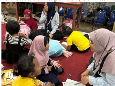
Gambar 4. Kegiatan Pembelajaran Hari Ketiga

Hari ketiga diisi dengan pembelajaran Bahasa Indonesia. Materi yang diajarkan meliputi pengenalan kata-kata baru, membaca cerita pendek, dan latihan menulis.