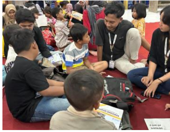
Gambar 5. Kegiatan Pembelajaran Hari Keempat