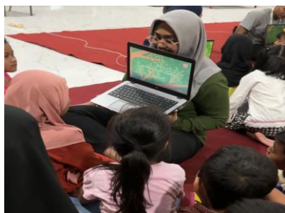
Gambar 3. Kegiatan Pembelajaran Hari Kedua