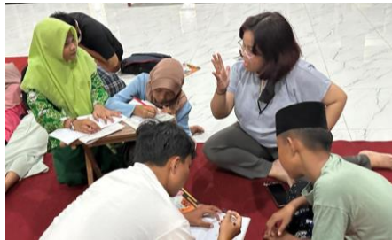
Gambar 6. Kegiatan Pembelajaran Hari Kelima

Hari kelima didedikasikan untuk pembelajaran Matematika dasar, termasuk pengenalan angka, operasi penjumlahan dan pengurangan sederhana, serta permainan matematika.