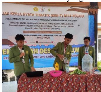
Gambar 3. Demonstrasi Pembuatan Pupuk Organik Cair (POC)

Demonstrasi pembuatan POC dilakukan untuk memperagakan langkah-langkah tersebut secara praktis. Presentasi dan demonstrasi yang dilakukan oleh mahasiswa KKN-T Belanegara kelompok 6 Mojokerto UPN “Veteran” Jawa Timur yang diilustrasikan pada Gambar 3.