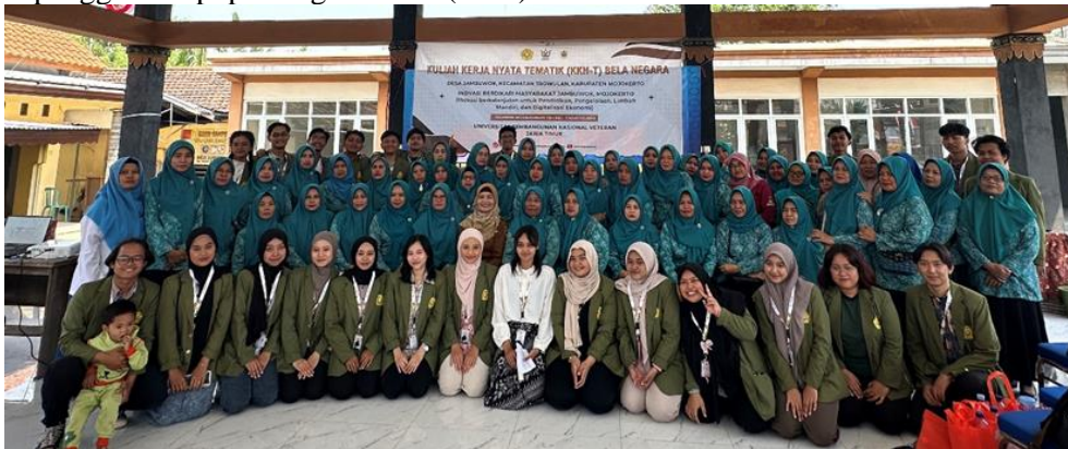
Gambar 1. Peserta Sosialisasi dan Pelatihan Pembuatan Pupuk Organik Cair

Program kegiatan sosialisasi dan pelatihan pembuatan pupuk organik cair (POC) dari sampah organik yaitu sampah sisa sayur-sayuran dan buah-buahan di Desa Jambuwok, Kecamatan Trowulan, Mojokerto yang dihadiri oleh kepala desa, perangkat desa, dan ibu-ibu Pemberdayaan dan Kesejahteraan Keluarga (PKK) desa Jambuwok dengan jumlah peserta sebanyak 60 orang. Pemberian materi sosialisasi berasal dari mahasiswa KKN-T Belanegara kelompok 6 Mojokerto, Universitas Pembangunan Nasional “Veteran” Jawa Timur. Kegiatan ini dilatarbelakangi atas penumpukan sampah organik di tempat pembuangan sampah (TPS) desa. Dan bertujuan untuk memberikan pemahaman mengenai pentingnya pengelolaan sampah dan manfaat penggunaan pupuk organik cair (POC).