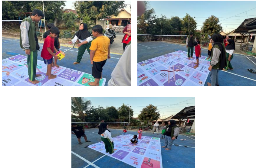
Gambar 2. Kegiatan Taman Bermain Bersama Anak - Anak

Wulandari 1, Bimantoro 2, Firmansyah 3, Ghazian 4, Anggraini 5, Endjani 6, Wijaya 7, Gunawan 8, Wati 9, Maulana 10