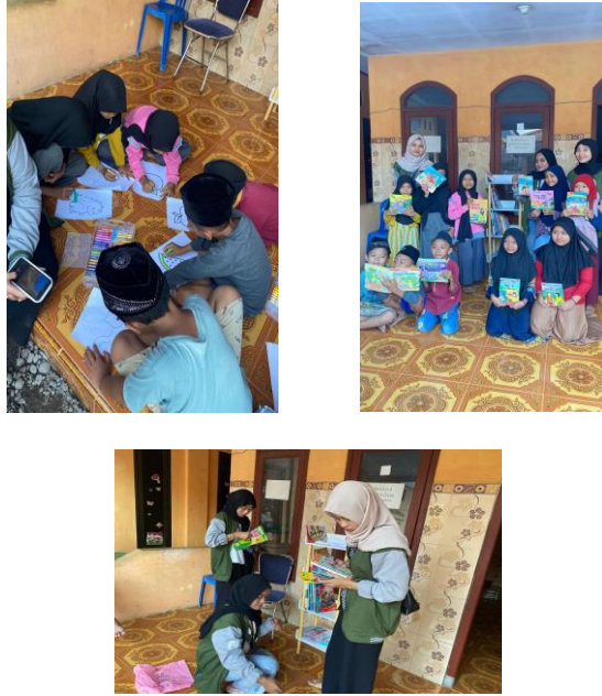
Gambar 1. Kegiatan Pojok Baca Bersama Anak – Anak

Wulandari 1, Bimantoro 2, Firmansyah 3, Ghazian 4, Anggraini 5, Endjani 6, Wijaya 7, Gunawan 8, Wati 9, Maulana 10