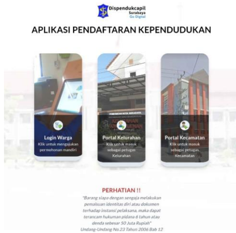
Gambar 1. Web KNG Login Akun Mandiri Warga.

Salah satu upaya yang dilakukan adalah pengembangan platform E-Government yang user-friendly dan mudah diakses oleh masyarakat. Dengan adopsi teknologi yang canggih dan intuitif, warga Surabaya dapat dengan mudah mengakses informasi, melakukan transaksi, dan memberikan masukan kepada pemerintah secara online, tanpa harus datang ke kantor pelayanan. Implementasi Klamped New Generation (KNG) di Surabaya, termasuk di Kelurahan Medokan Semampir sebagai studi kasus, menunjukkan komitmen pemerintah dalam menghadirkan pelayanan publik yang lebih responsif terhadap kebutuhan masyarakat. Dengan menggunakan teknologi, proses administrasi menjadi lebih efisien dan minim kesalahan, sementara transparansi data meningkat sehingga masyarakat dapat lebih terlibat dalam proses pengambilan keputusan.