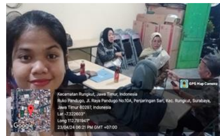
Gambar 4. Dokumen Pelaksanaan Pelayanan Sayang Warga di Balai-Balai RW.