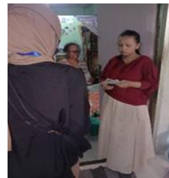
Gambar 3. Dokumentasi Dari Pelaksanaan Pelayanan Jemput Bola Adminduk

Gambar di atas merupakan beberapa dokumentasi dari pelaksanaan pelayanan jemput bola adminduk ini, penulis merasa bahwa melalui pelayanan ini merupakan pelayanan yang relevan untuk dilakukan di dalam mencapai tujuan dari Kepala Disdukcapil Kota Surabaya yaitu menginginkan untuk warga yang tinggal di Kota Surabaya